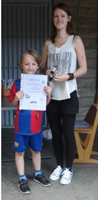
Meister der 1. Klassen Klassen

Schulmeisterschaft 2015 – Meisterparade und Endstand: